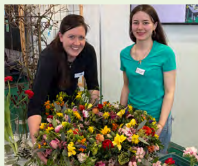
Alex-Power: Ausbilderin und Auszubildende mit dem floralen Blütenkranz.

Wir sind stolz auf unsere Auszubildende und gratulieren ihr herzlich zu dieser großartigen Leistung!