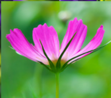
Lust auf frisches Grün

..... Die Pflanze des Jahres des Bayerischen Gärtnerei- Verbandes.