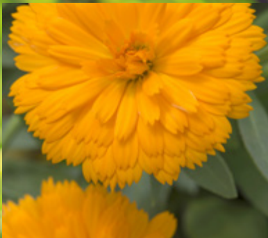
Luggi – unser Sunnyboy

..... Die Pflanze des Jahres des Bayerischen Gärtnerei- Verbandes.